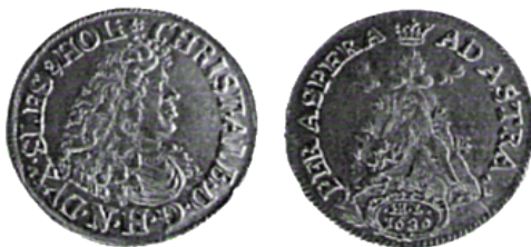
4. Slesvig-Holsten-Gottorp, Christian Albrecht, dukat, 1689. Skala 1,5:1.