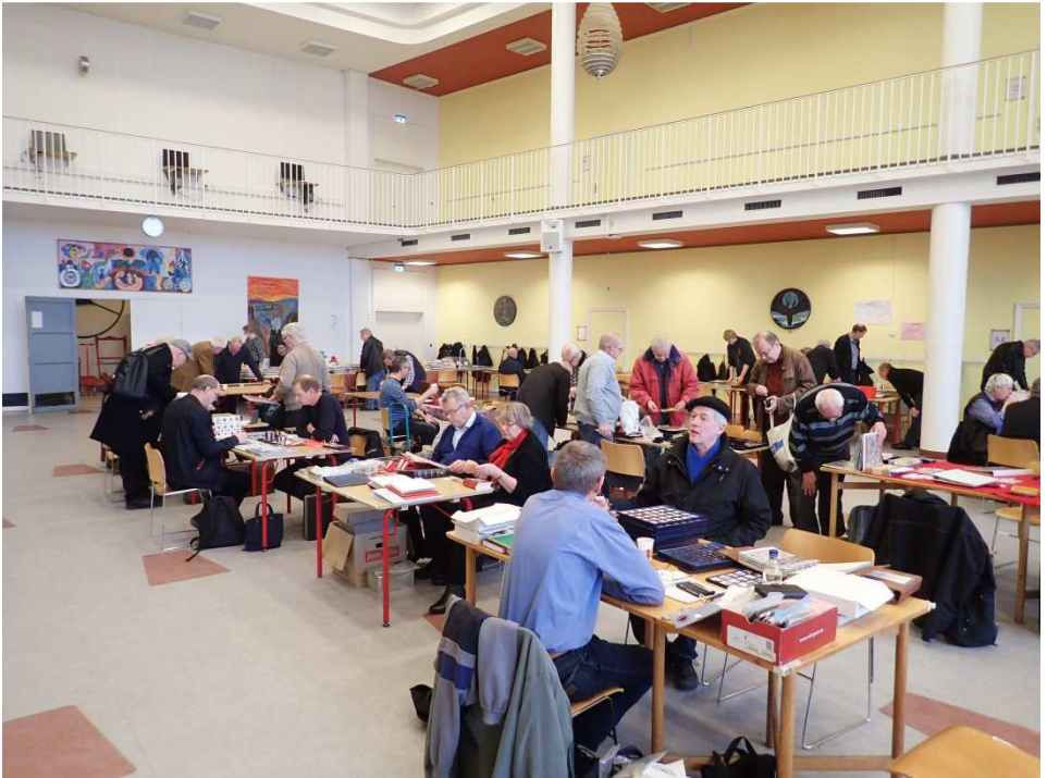
Stor aktivitet på Møntbørsen