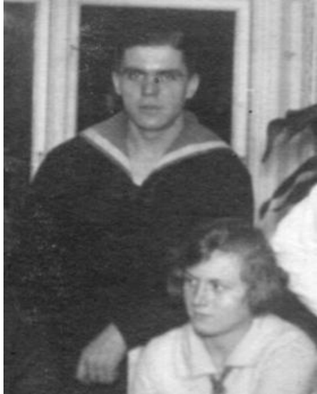
Farfar og farmor 1922-23