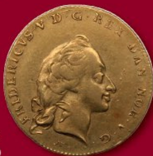
Frederik V, Kurantdukat 1758, H 22A, kv. 1+ Hammerslag: DKK 16.500