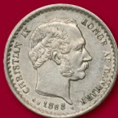
Christian IX, 10 øre 1888, H 16A, kv. 0 Hammerslag: DKK 6.500

Vurderingsbesøg foretages efter aftale i hele landet.