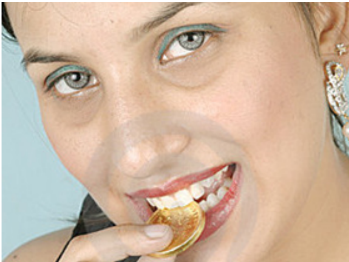
Årets side 9-pige