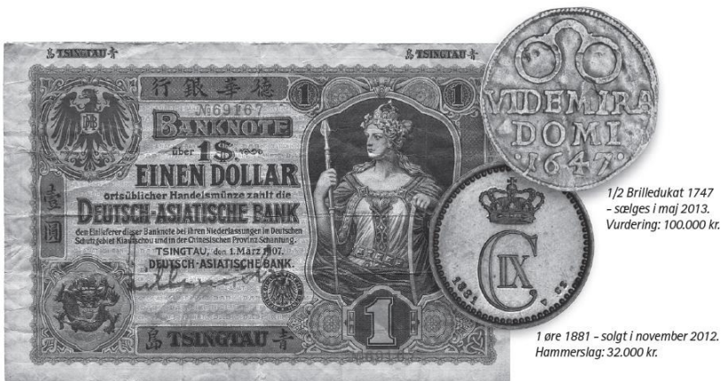
China, Deutsch-Asiatische Bank, Tsingtau Branch, 1 Dollar 1907 - sælges i maj 2013. Vurdering: 15.000 kr.

Hver anden søndag afholder vi møntauktioner på nettet.