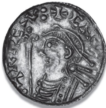
Knud d. Store, penning, Dover. Sælges på auktion 848, 13. maj 2014.

Vi søger løbende alverdens mønter, pengesedler og medailler til vores traditionelle og net-auktioner.