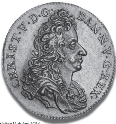
Christian V, dukat 1694. Sælges på auktion 848, 13. maj 2014.

Hver anden søndag afholder vi møntauktioner på nettet.