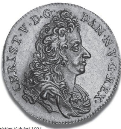
Christian V, dukat 1694. Sælges på auktion 848, 13. maj 2014.

Hver anden søndag afholder vi møntauktioner på nettet.