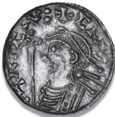
Knud d. Store, penning, Dover. Sælges på auktion 848, 13. maj 2014.

Vi søger løbende alverdens mønter, pengesedler og medailler til vores traditionelle og net-auktioner.