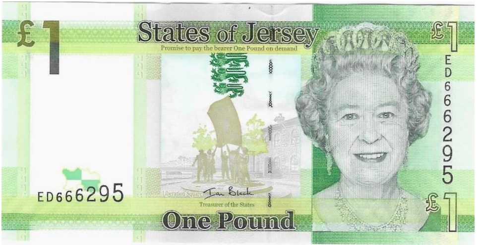
1 £ Jersey med Liberty skulpturen på Liberty Square